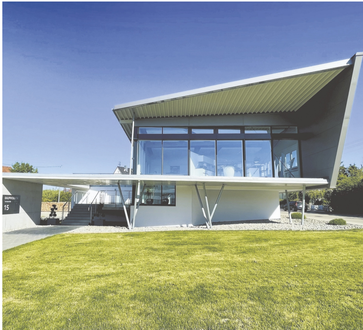
Allein das beeindruckende Firmengebäude von Bauprojekta im schwäbischen Geislingen-Binsdorf demonstriert die kreative und visionäre Energie des Unternehmens.