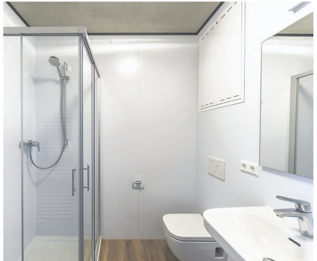
Zur Ausstattung gehören auch eine vollwertige Küche ohne Abstriche sowie ein Bad mit Duschkabine, Toilette und Waschbecken. Im Keller stehen zusätzlich Waschmaschinen sowie Trockner bereit.