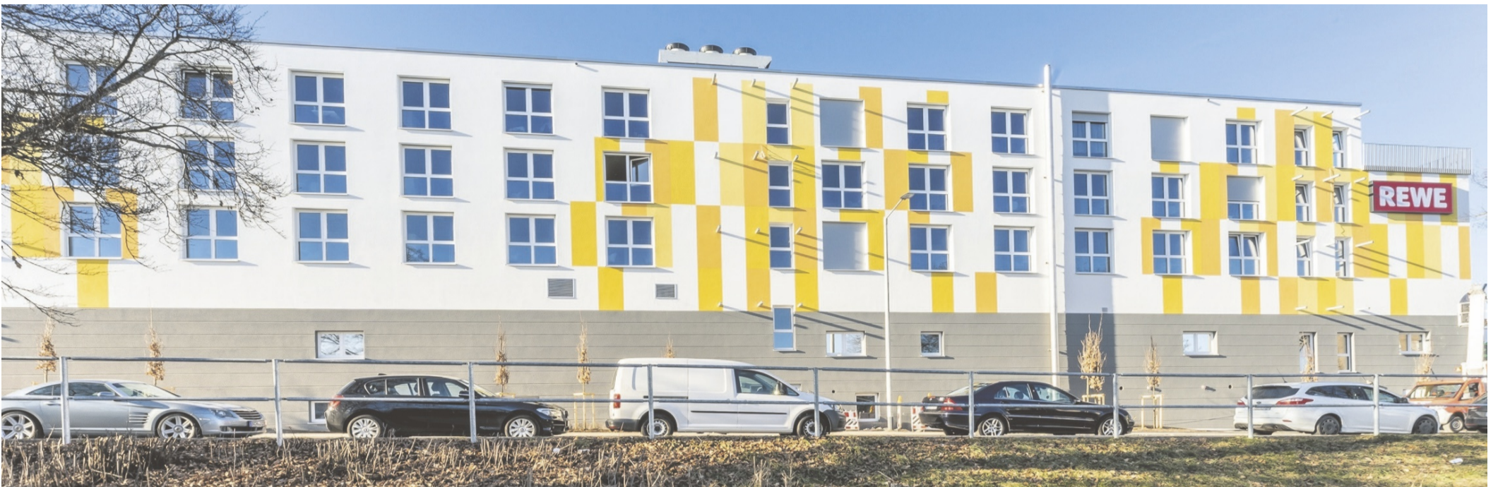
Das fünfstöckige Gebäude verfügt über eine Tiefgarage mit 84 Stellplätzen für die Bewohner der 163 Mikroapartments. Nur noch wenige Wohnungen sind verfügbar.