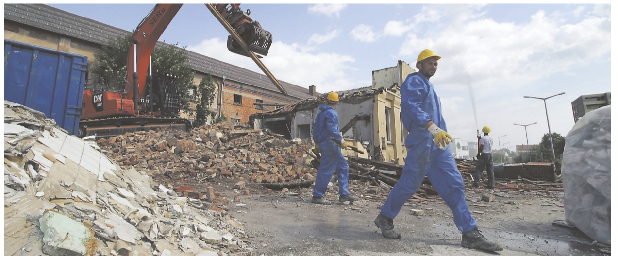
Beim Bau wurde auf Nachhaltigkeit Wert gelegt. So ist das Gebäude nach dem KfW-40-Standard erbaut, verfügt über eine Pelletheizung sowie eine Photovoltaikanlage, die Wohnungen und Rewe mit Strom versorgen. Baubeginn war im Herbst 2020, nachdem 2017 umfassende Abrissarbeiten durch die SER GmbH aus Heilbronn auf dem Gelände stattgefunden hatten.