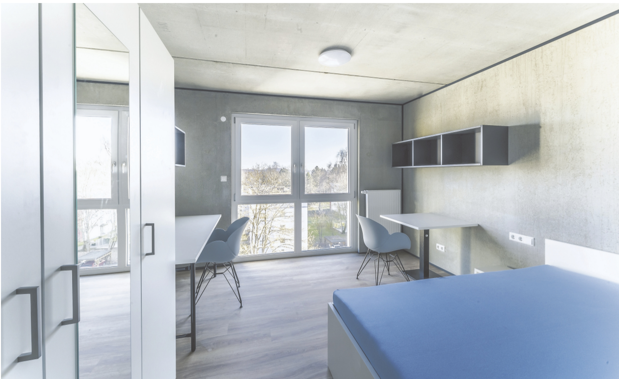
Zwischen 21 und 36 Quadratmetern sind die 163 Mikroapartments groß und bieten eine komplette Möblierung. Die Mieter können also direkt einziehen und sich wohlfühlen.