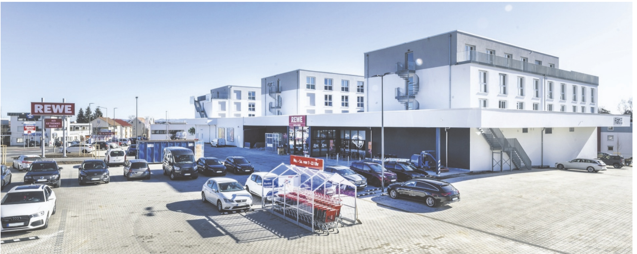
Auf dem rund 12 600 Quadratmeter großen Gelände der Alten Ziegelei sieht es nun vollkommen anders aus: Blickfang ist ein neues Gebäude, das Mikrowohnungen und einen Rewe-Markt samt Bäckerei beinhaltet.