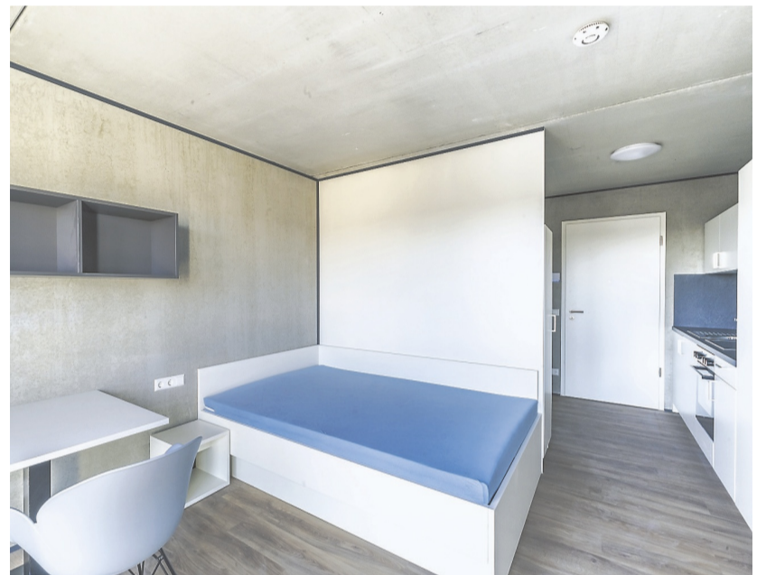
Mikrowohnungen sind der neue Wohntrend. So sollen vor allem Studierende und Auszubildende günstig wohnen.

Millionen Euro teuer war das Großprojekt auf dem Gelände der Alten Ziegelei, das nicht nur 163 Mikroapartments, sondern auch einen Nahversorger beinhaltet.