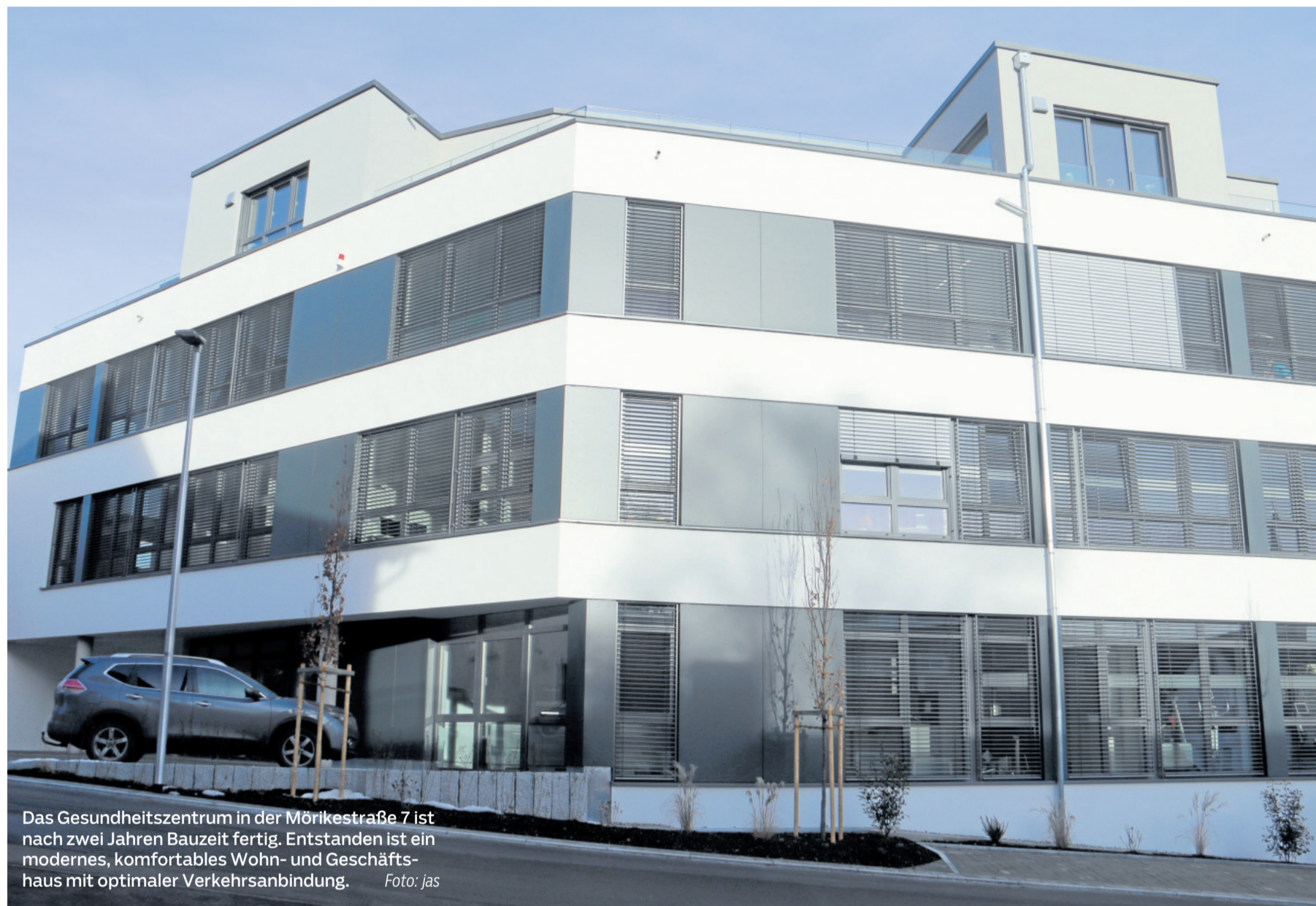
Das Gesundheitszentrum in der Mörikestraße 7 ist nach zwei Jahren Bauzeit fertig. Entstanden ist ein modernes, komfortables Wohn- und Geschäftshaus mit optimaler Verkehrsanbindung.

Die ursprünglich erlaubte Nutzung sah einen Parkplatz vor. Es war im Folgenden notwendig, mit der Stadt Balingen einen neuen Bebauungsplan zu erstellen. Im Juli 2015 wurde dieser rechtskräftig, sodass die Planung für das Gesundheitszentrum im Dezember 2015 eingereicht werden konnte. Am 21. Juli 2016